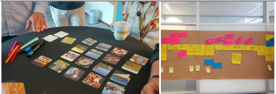
Figuur 3 Voorbeeld kernwaardensessie met kaartspel en brown-paper

Doordat we samen de ontwikkelingsgeschiedenis van de locatie hebben besproken, kunnen we vanuit hetzelfde kennisniveau starten met het tweede deel van de werksessie. Samen met de genodigden gaan we op zoek naar de kernwaarden van het gebied. Dit doen we in groepjes met behulp van een kaartspel, speciaal ontworpen voor deze plek. We delen de aanwezigen op in groepjes, die onder leiding van een moderator drie kernwaarden selecteren. Kiezen is lastig, maar zorgt voor focus. Tijdens een centrale terugkoppeling reflecteren we op de kernwaarden en thema's die aan bod kwamen. Al pratende ontstaat er een gezamenlijke taal en consensus over wat de kernkwaliteiten van het gebied zijn.