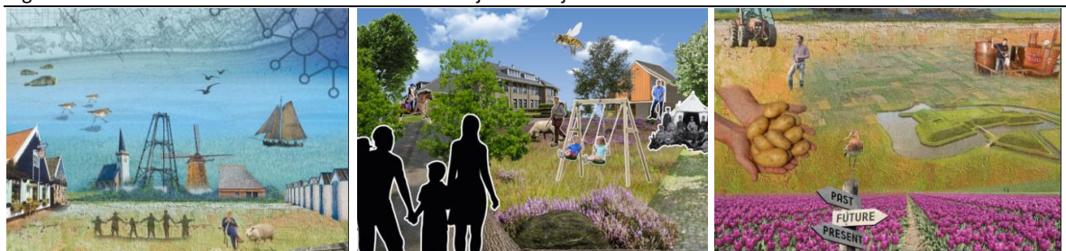
Figuur 4 Voorbeeld moodboards horend bij verhaallijnen

De voorlopige verhaallijnen verbeelden de uitkomst van de eerste werksessie. Ze worden in tekst en een overzichtstabel weergegeven. Ook worden ze visueel gemaakt in moodboards. Een beeld zegt immers meer dan duizend woorden. Deze verhaallijnen leggen we in de tweede werksessie terug aan de genodigden om te zien of ze zich erin herkennen.