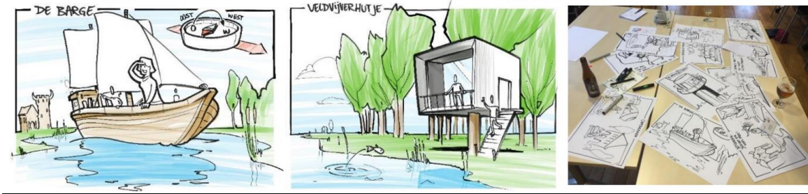
Figuur 5 Voorbeelden sneltekenaar

In het laatste onderdeel van de sessie bespreken we welke verhaallijn (of combinatie daarvan) de voorkeur heeft. Dit gesprek voeren we aan de hand van de uitgangspunten van Deep Democracy, waarbij we het besluitvormingsproces laten verlopen met aandacht en waardering voor andere opvattingen. Aan het einde van deze werksessie hebben we ons kompas voor de visualisatie in handen. Nu is het een kwestie van concretisering en uitwerking. Dat doen we in de volgende stap.